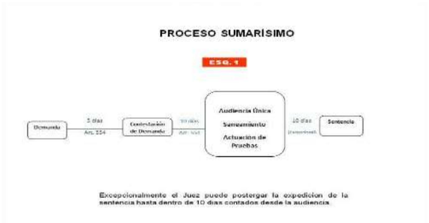
Figura 3. Esquema del Proceso Sumarísimo

Nota: Esquema del Proceso Sumarísimo.