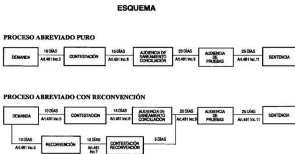
Figura 2. Esquema del Proceso Abreviado

Nota: Esta imagen es el Esquema del Proceso Abreviado.