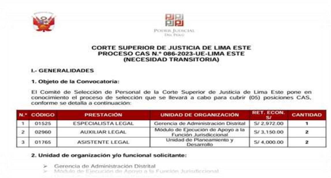
Figura 4. Extracto de Convocatoria de Personal CAS

Nota: Extracto de Convocatoria CAS. Extraída de (Convocatorias de la Web del Poder Judicial)