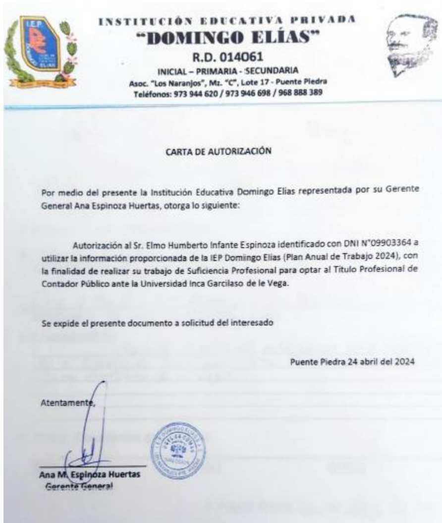
Figura 4 Carta de Autorización - Elaboración propia