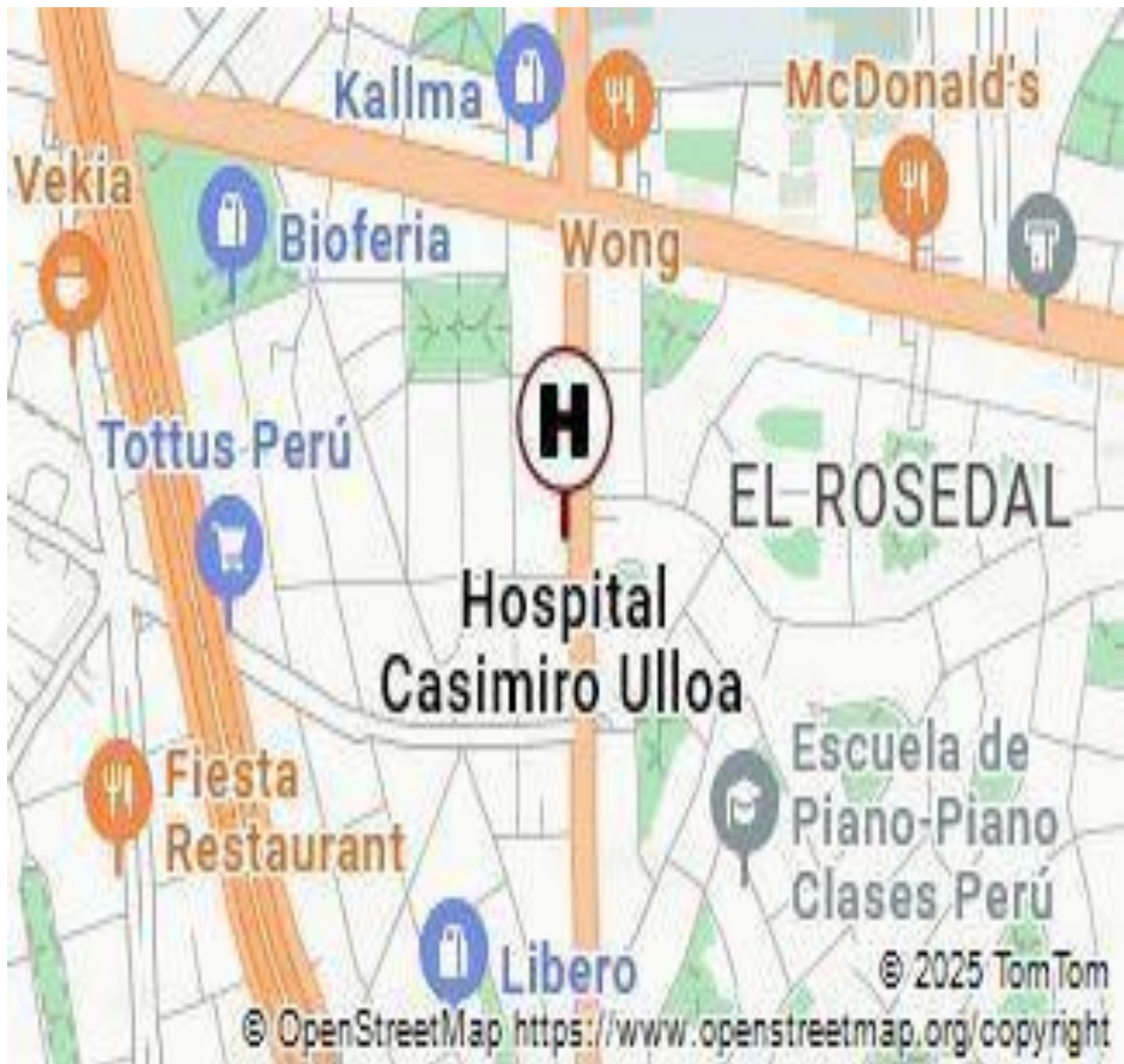
Figura 1. Ubicación del Hospital de Emergencias José Casimiro Ulloa

Nota. Vista satelital de la ubicación del hospital en Lima, Perú, mostrando su posición geográfica exacta en las coordenadas -12.1281188, -77.0177211. De Google Maps , 2025.