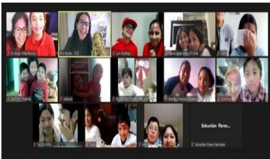
Figura 6: Celebración del Día de la madre

En el año 2021 empecé a trabajar en la institución educativa “Sagrado Corazón de Belén” ubicado en el distrito de Los Olivos, que brinda servicio educativo en el nivel inicial y primaria. En esta experiencia, el cargo que desempeñé fue el de tutora de tercer grado de primaria. Todas las aulas trabajan con la modalidad de unidocencia, esto quiere decir que, la tutora dicta los cursos de Matemática, Comunicación, Ciencia y DPSC.