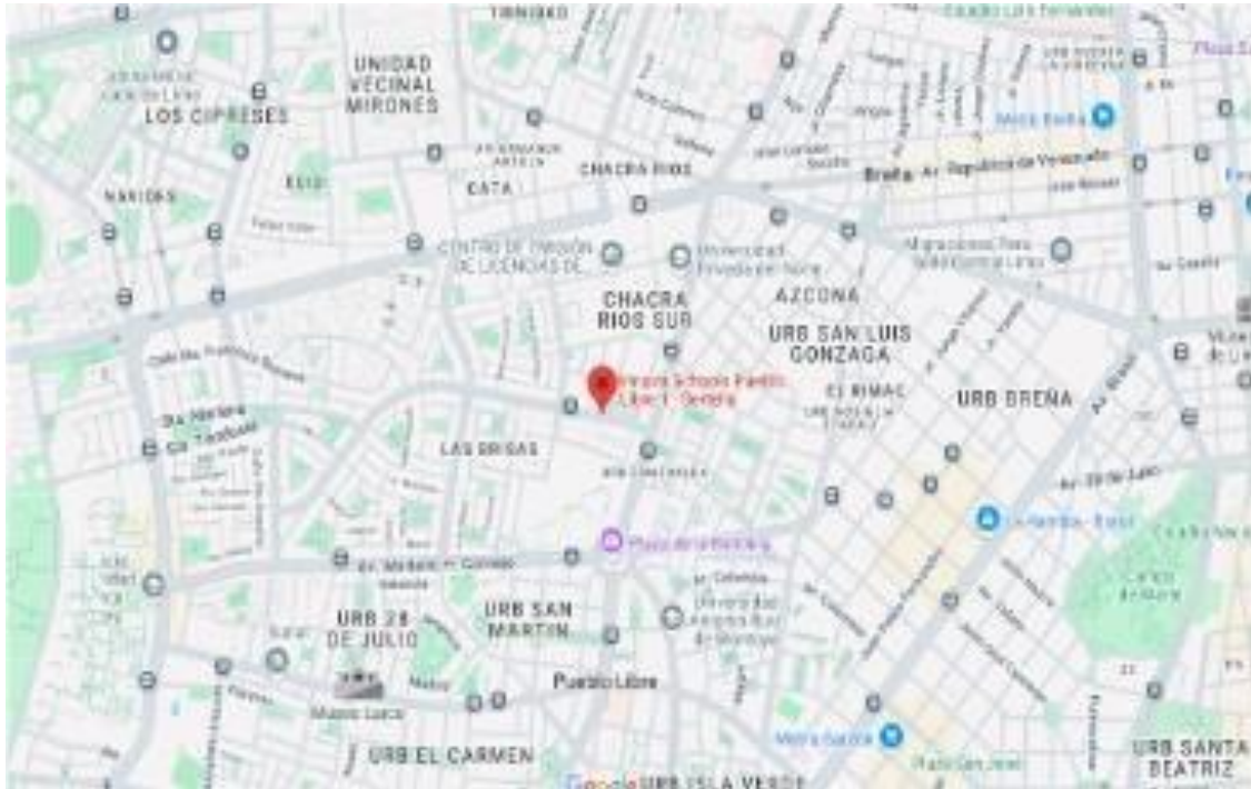
Figura 2: Ubicación del colegio Innova Schools sede Bertello.