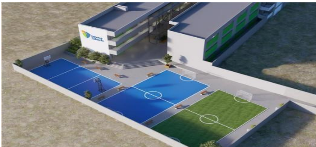
Figura 1: Canchas de vóley, básquet y fútbol de la institución educativa privada Innova Schools.