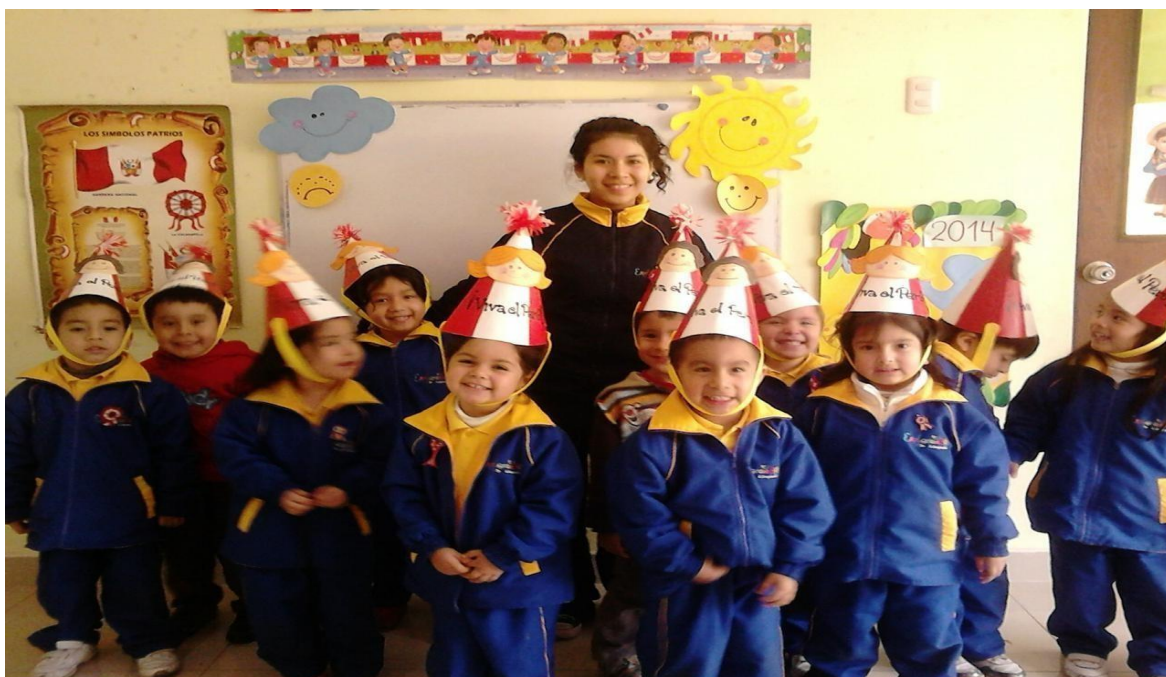
Figura 5: Aula de 3 años Kinder Explorando

Estudiar educación inicial fue mi base para poder empezar mi vida laboral. Mi primer trabajo en el ámbito educativo fue en el año 2014 hasta el 2026, en el kínder “Explorando” ubicado en el distrito de Pueblo Libre. En esta institución, mi cargo era el de auxiliar del aula de 3 años. Trabajar al lado de una docente de mucha experiencia me dio la oportunidad de aprender sobre manejo de aula, comunicación con padres de familia, toma de decisiones en situaciones difíciles, etc. De igual manera, pude estar en contacto con diferentes metodologías educativas y la elaboración de material concreto para el desarrollo de clases.