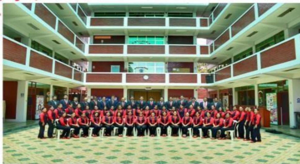
Figura 7: Plana docente de la institución educativa privada “Los Niños de Jesús” año 2022