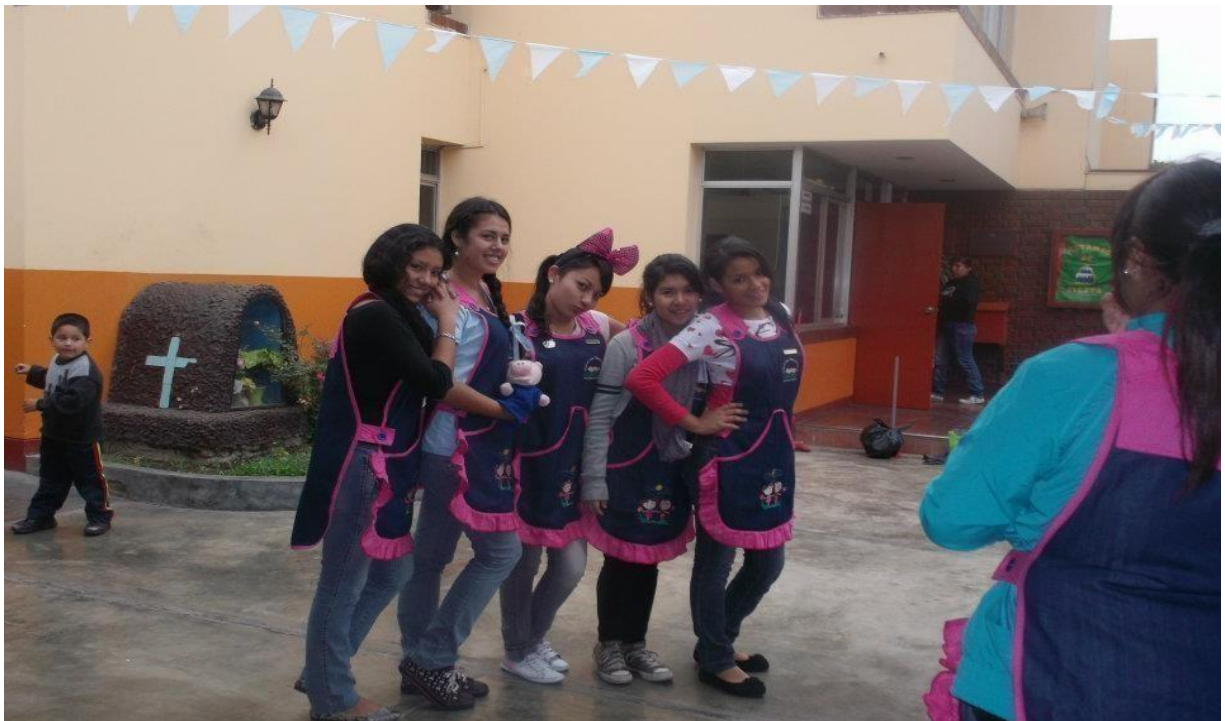
Figura 4: Visita a Aldeas S.O.S en el distrito de Carabayllo, Fuente: Elaboración propia.

En el año 2012 estudié en la Escuela de Educación Superior Pedagógica Pública Emilia Barcia Boniffatti. Se caracteriza por formar maestras de nivel inicial. La particularidad de esta institución es que los estudiantes realizan sus prácticas pre profesionales desde el primer ciclo de estudios para que puedan estar seguros de la carrera que eligieron. Esta experiencia me sirvió para reafirmar mi vocación de servicio que es muy importante para la carrera de educación.