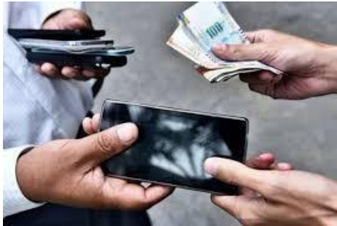
Fig. 3 Receptación

La RECEPCION es un delito muy difundido, incluso mucho más de lo que imaginamos, pues se realiza en gran número pero con productos pequeños de poca escala y en muchos de los casos no llega a sancionarse o no es derivado como receptación, se lleva como receptación a las comisarias e inician trámite solo en los casos en los que se desean hacer algún daño a alguna persona y lamentablemente muchas veces, dados los mínimos requisitos que se solicitan, se inicia la demanda únicamente con la manifestación de alguna persona que puede ser la afectada o no, y solo con ello, repito, se inicia el trámite.