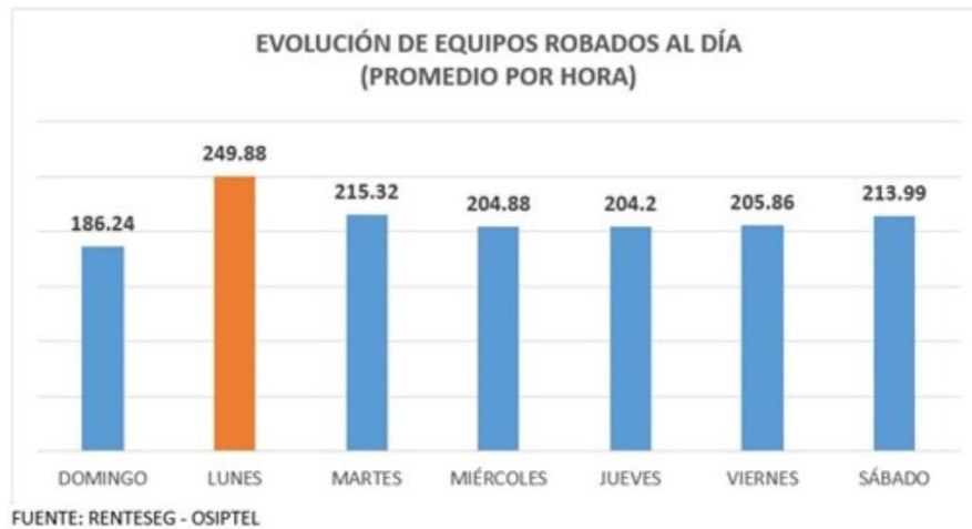
Tabla 2. Evolución diaria de equipos robados Lima

Se adjunta cuadro de evolución de robos promediados por hora de manera diaria, de mucho realmente grave, (RENTESEG - OSIPTEL, 2023)