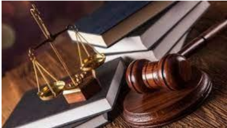
Fig. 1 Estudio Jurídico