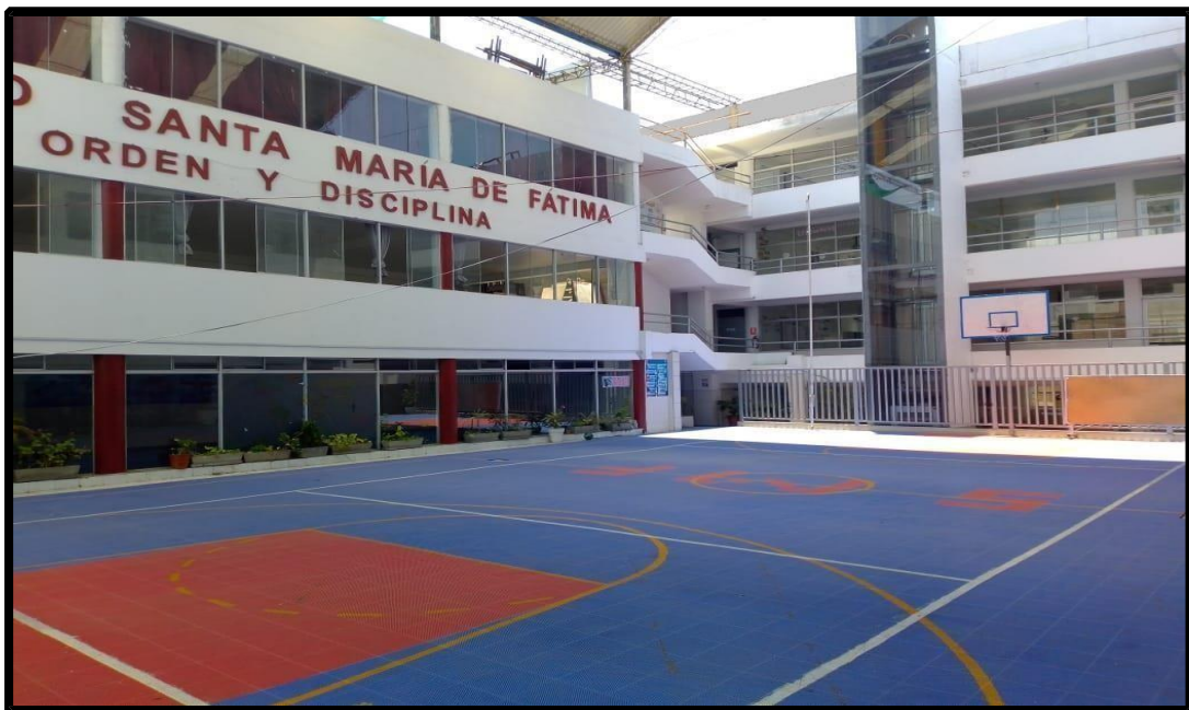
Figura N° 1. Patio central del centro educativo

Desde el año 1991 poco tiempo le basto para tener operativos los 3 niveles desde Kindergarten hasta secundaria. En el colegio se imparte: natación ping pong, ajedrez, talleres de música, danzas, basquetbol y Vóley. Aparte que hay poli docencia desde el 5to de primaria. Con una formación católica cristiana que se preocupa por los valores en el perfil de egreso del educando. Contando con un staff amplio de más de 8 docentes por nivel. Además, cuenta el departamento de psicología, tutoría personalizada por grados, personal administrativo, mantenimiento, servicio de movilidad entre otras bondades.