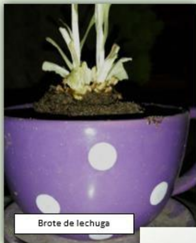
Brote de lechuga