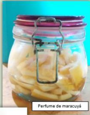
Perfume de maracuyá