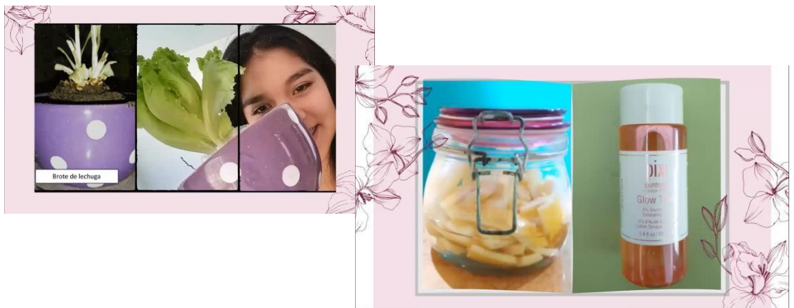
PERFUME DE MARACUYÁ

3.- Productos presentados como fruto del trabajo del trabajo en equipo ejecutado por los estudiantes del tercero de secundaria orientado al cuidado del medio ambiente: Proyecto “Planeta S.O.S.”: