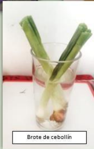
Brote de cebollín