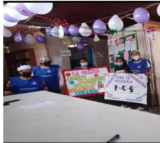
Olla Comun : Quijote Yanapakuy en Lomas de Chahuani Pte piedra.

Proceso de trabajo de enero a diciembre 2021