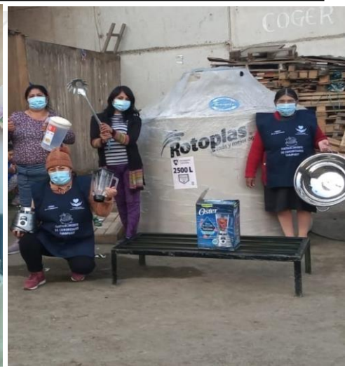
Olla Común: Esperanza por un mañana mejor, Agrupación Familiar 15 de marzo en San Juan de Lurigancho

Proceso de Trabajo Enero a Diciembre 2021