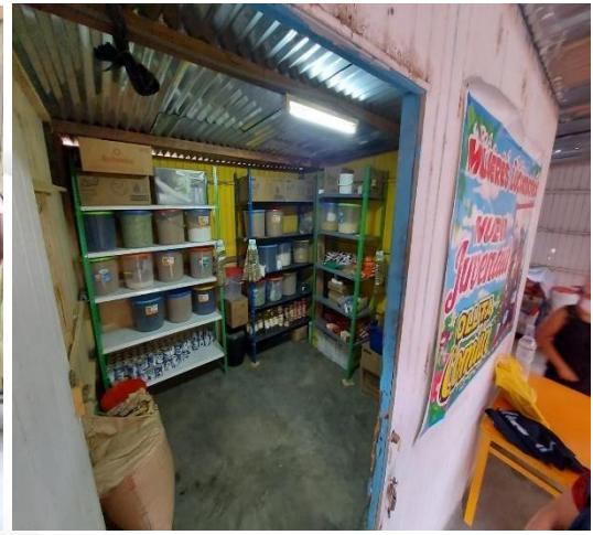
Olla común: Mujeres Luchadoras Agrupación Familiar Casa Blanca en San Juan de Lurigancho

Proceso de trabajo Enero a Diciembre 2021