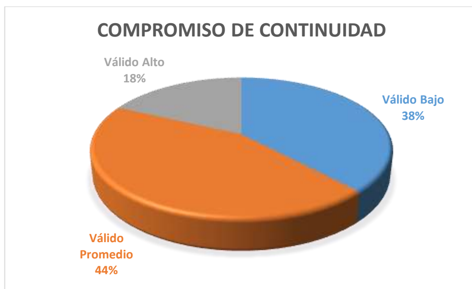
Figura 4. Dimensión de continuidad

De acuerdo a la tabla y figura correspondiente. De la totalidad de los trabajadores públicos, un 18% de los trabajadores están comprometidos con su centro laboral a un nivel Alto. Así mismo un 38% de los trabajadores encuestados puntúan en un nivel bajo de compromiso, además el 44% de los trabajadores públicos reflejan un nivel Promedio de identificación en relación al proceso de continuidad en su centro laboral.