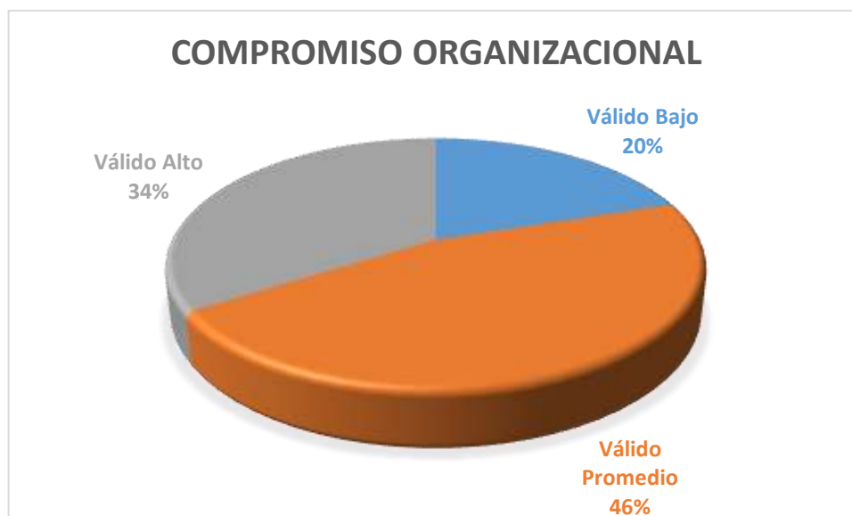
Figura 1. Compromiso organizacional

De acuerdo a la tabla y figura correspondiente. De la totalidad de los trabajadores públicos, un 34% de los trabajadores están comprometidos con su centro laboral a un nivel Alto. Así mismo un 20% de los trabajadores encuestados puntúan en un nivel bajo de compromiso, además el 46% de los trabajadores públicos reflejan un nivel Promedio de identificación con su centro laboral.