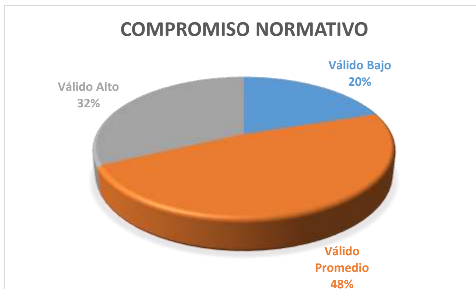
Figura 3. Dimensión normativa

De acuerdo a la tabla y figura correspondiente. De la totalidad de los trabajadores públicos, un 32% de los trabajadores están comprometidos con su centro laboral a un nivel Alto. Así mismo un 20% de los trabajadores encuestados puntúan en un nivel bajo de compromiso, además el 48% de los trabajadores públicos reflejan un nivel Promedio de identificación en relación a las normas de su centro laboral.