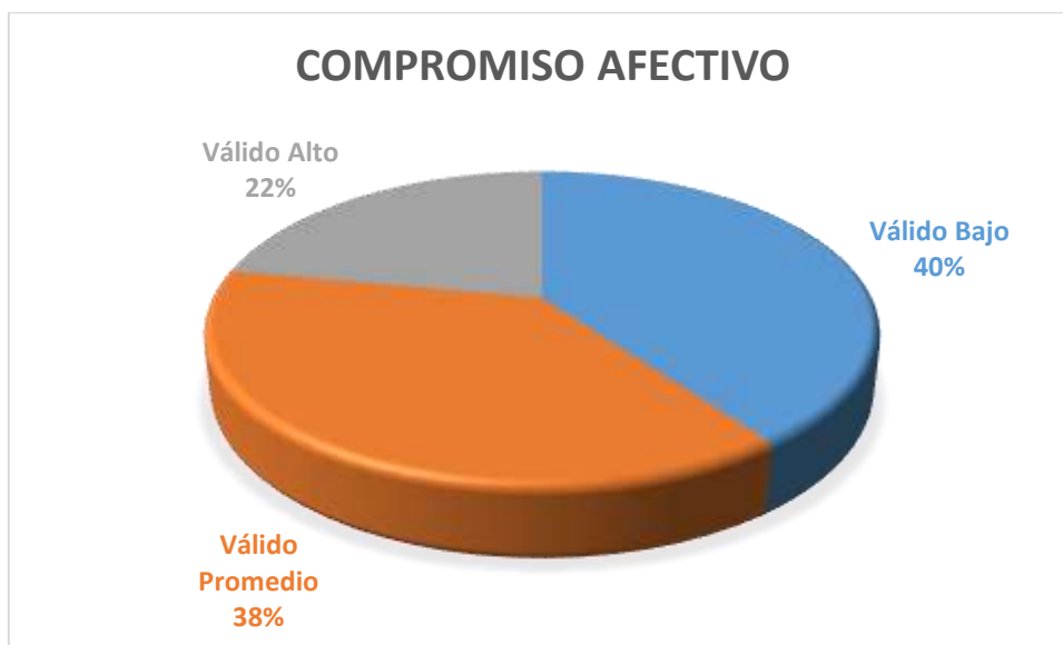
Figura 2. Dimensión afectiva

De acuerdo a la tabla y figura correspondiente. De la totalidad de los trabajadores públicos, un 22% de los trabajadores están comprometidos con su centro laboral a un nivel Alto. Así mismo un 40% de los trabajadores encuestados puntúan en un nivel bajo de compromiso, además el 38% de los trabajadores públicos reflejan un nivel Promedio de identificación afectiva con su centro laboral.