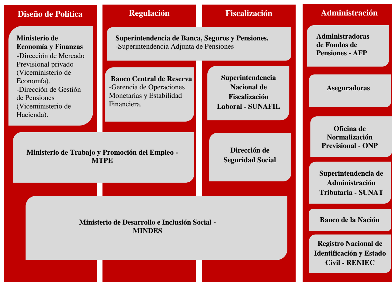
Figura 1 Mapa Institucional del Sistema de Pensiones del Perú.

La administración está directamente bajo la responsabilidad de las ONP, empresas aseguradoras, AFP's, SUNAT, Banco de la Nación y la RENIEC. Cada entidad entrega los servicios y beneficios pensionarios de acuerdo con sus reglamentos y normas establecidas. Estas entidades programan planes de acción para ejecutar lo planteado en el diseño de políticas, normar regulatorias, cumplimiento de las disposiciones fiscalizadoras. Estas figuras jurídicas son las que directamente gestionan el servicio con los administrados o beneficiarios.