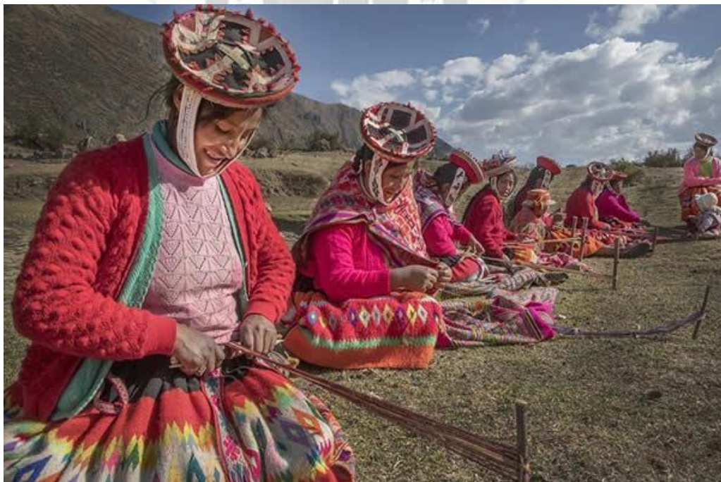
Gráfico 4: Textiles en la comunidad de Patacancha.