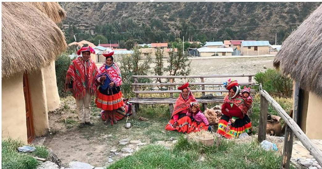
Gráfico 2: Ciudad de Patacancha