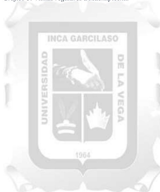
Gráfico 5: Visitas regulares a Machupicchu.

FUENTE: Ministerio de Cultura - Dirección Desconcentrada de Cultura - Cusco ELABORACIÓN: MINCETUR/MTD/CIETA-DIA/ITA Con información disponible a junio de 2022.