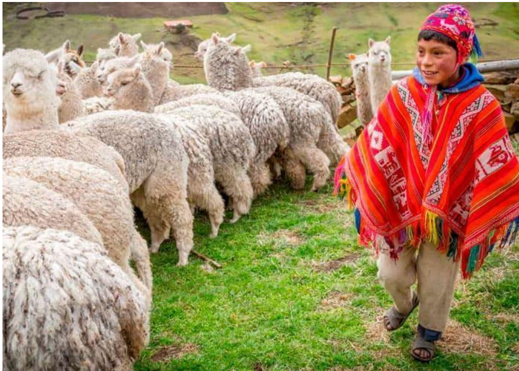
Gráfico 3: Patacancha, zona alpaquera.