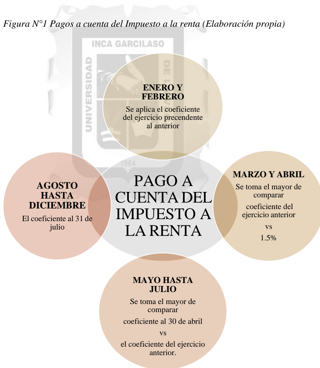
Figura N°1 Pagos a cuenta del Impuesto a la renta (Elaboración propia)

Además, que el contribuyente no cuenta con una guía que sirva como soporte para la presentación de estos requisitos y muy pocas probabilidades a favor de lo solicitado.