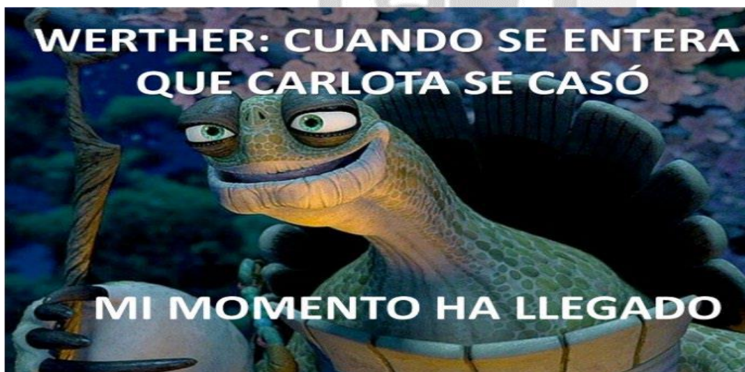
Figura6 Meme Creado por alumno de tercer año

Nota. Con este meme, la alumna demuestra la conclusión a la que ha llegado el protagonista e infiere lo que sucederá después.