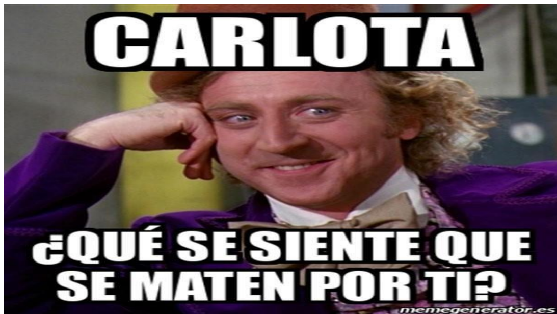
Figura5 Meme Creado por Alumna de Tercer Año

Nota. En este meme, a través de una pregunta sencilla se encierra la reflexión sobre el accionar de Carlota que desencadena la muerte de Werther