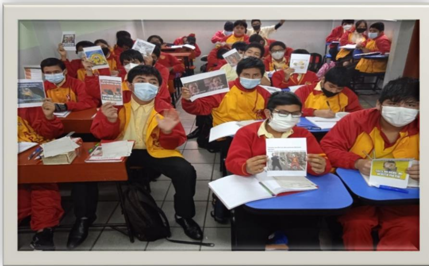
Figura 8 Publicación de Memes en el Periódico Mural