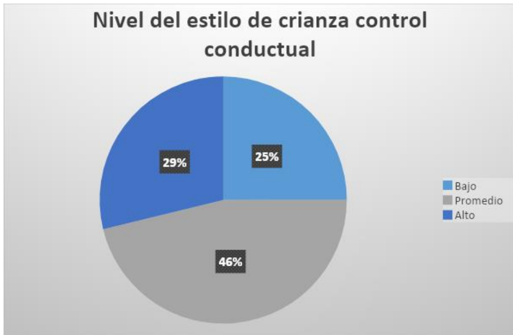
Figura 4. Nivel del estilo de crianza control conductual

Comentario: en la Figura 24 en el total de la muestra se puede contemplar que el mayor porcentaje es 46% lo que significa que los estudiantes perciben un nivel promedio en relación al estilo control conductual y el menor porcentaje es 25 % que significa un nivel bajo frente a este estilo. La sumatoria de porcentajes alto y promedio alcanzan un 75%, lo que representa un mayor nivel de apreciación hacia el estilo de crianza control conductual por parte de los padres hacia los hijos, es decir que hay una mayor cantidad de estudiantes que perciben que en sus hogares se manifiesta esta forma de crianza frente a los que no lo perciben.