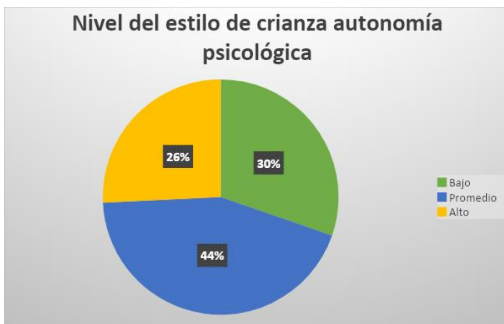
Figura 3. Nivel del estilo de crianza autonomía psicológica

nivel bajo frente a este estilo. La sumatoria de porcentajes alto y promedio alcanzan un 74%, lo que representa un mayor nivel de apreciación hacia este estilo por parte de los padres hacia los hijos, es decir que hay una mayor cantidad de estudiantes que perciben que en sus hogares se manifiesta este estilo de crianza frente a los que no lo perciben.